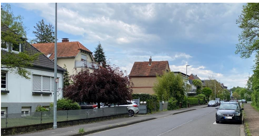
Bergisch Gladbacher Stadtgebiet: Gierather Straße auf Höhe der Hausnummer 158