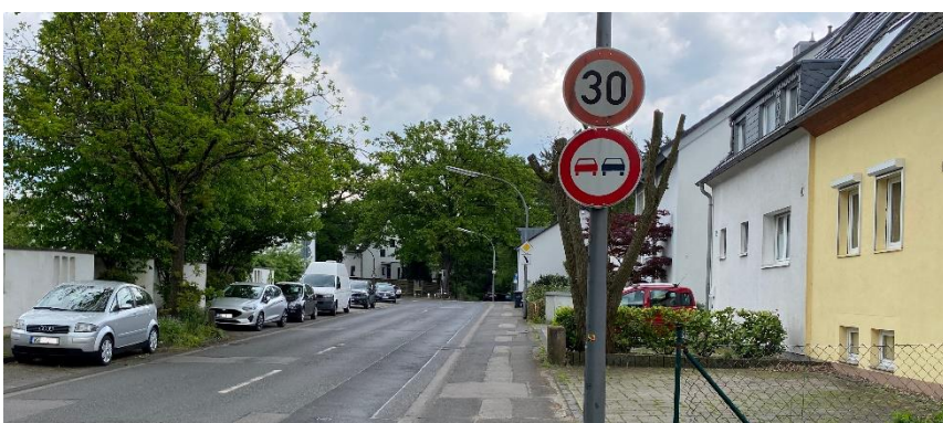
Kölner Stadtgebiet: Tempo 30 Schild vor Einmündung Refrather Straße