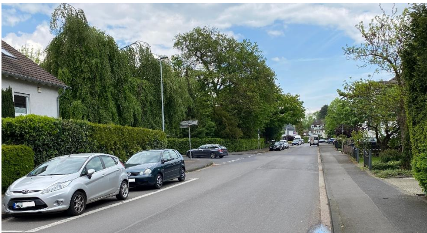
Bergisch Gladbacher Stadtgebiet: Gierather Straße an der Einnümdung Schloderdicher Weg