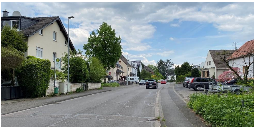
Bergisch Gladbacher Stadtgebiet: Gierather Straße auf Höhe der Haltestelle „Gierath“