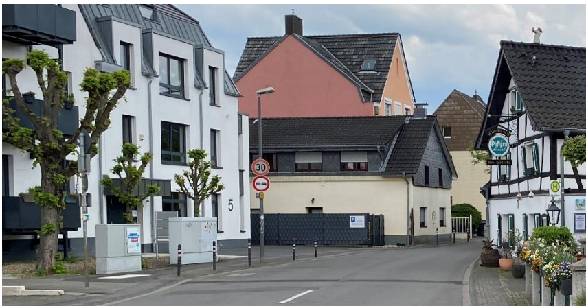
Kölner Stadtgebiet: Beginn der Gierather Straße beim Wirtshaus „Em Höttche“ mit Tempo 30 Schild