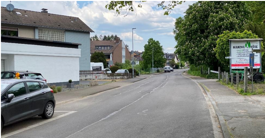
Bergisch Gladbacher Stadtgebiet: Gierather Straße auf Höhe der Firma Manzke&Böse