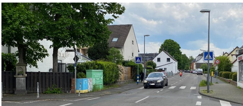
Kölner Stadtgebiet: Knotenpunkt Mühlenhofsweg / Penningsfelder Weg mit Tempo 30 Schild