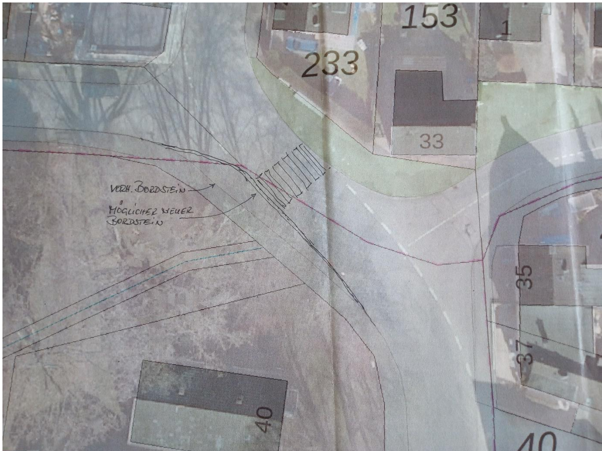
Skizze zur Umgestaltung der Kreuzung Gierather Straße / Ferdinandstraße / Dünnhofsweg